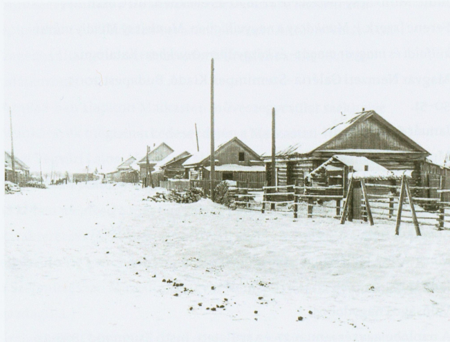
Tugijani falu, ahogy Schmidt Éva látta 1970 telén. E falu és nyelvjárása mintegy hanti „szülőfaluként” és „anyanyelvként” meghatározta Schmidt Éva további tevékenységét