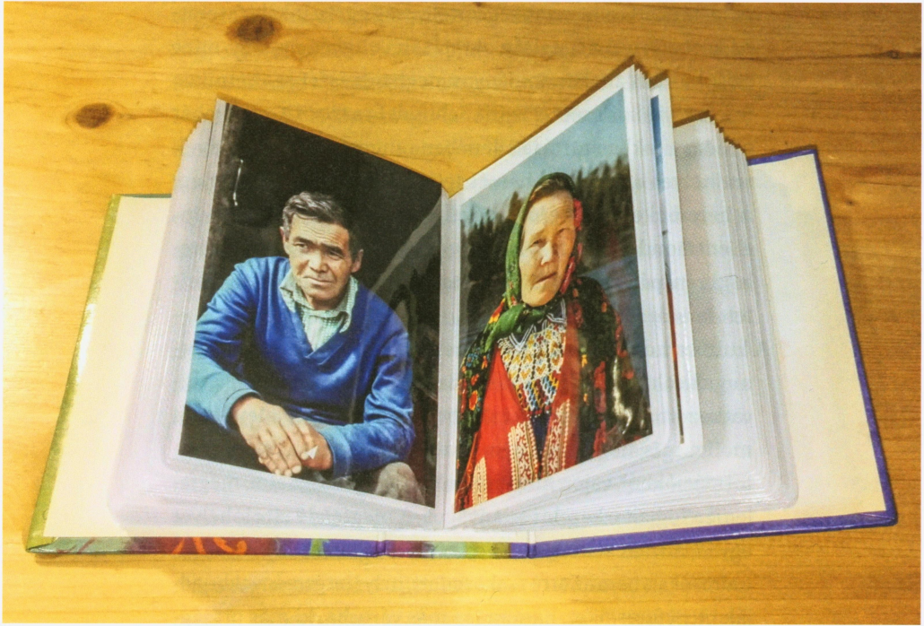
Schmidt Éva által összeállított fotóalbum a legkedvesebb adatközlőkről