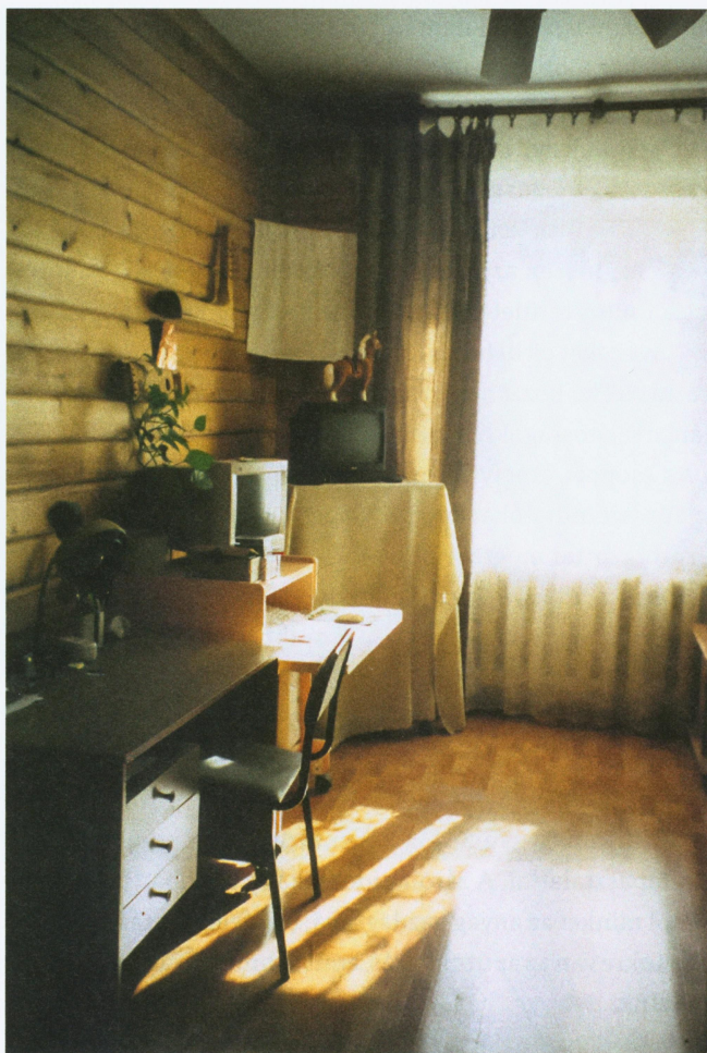
A Belojarszkiji Északi Hanti Folklorarchívum munkaszobája